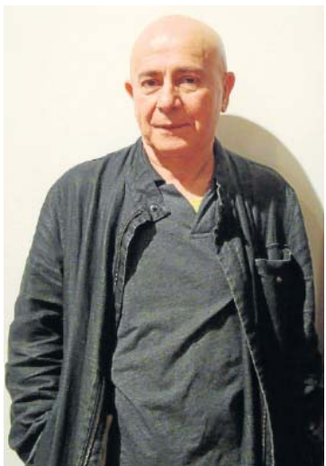
El autor Hugo Mujica

"Bajo toda la lluvia del mundo" Hugo Mujica Pre-Textos / 13 euros